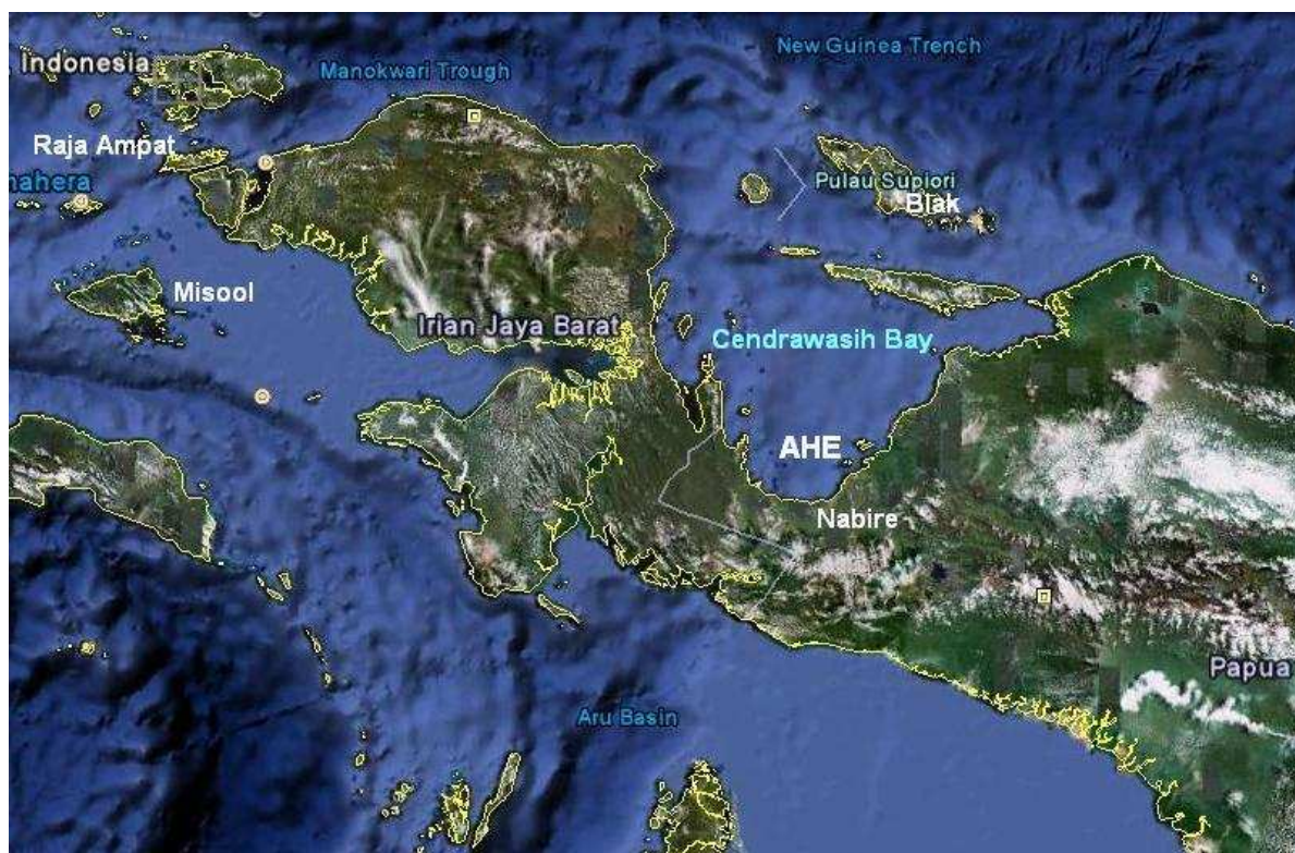
Ahe Island, Cendrawasih Bay